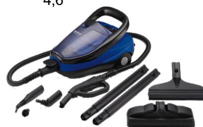
Steamtec 5 IH