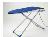
Žehlicí prkno Obj.č. 31000200